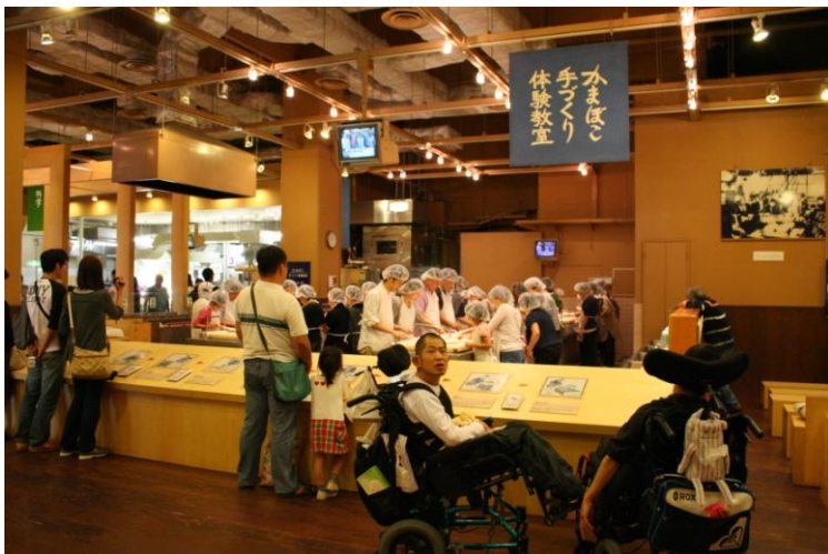
かまぼこ作り体験中

2日目は、ホテルから歩いて芦ノ湖へ、そして元箱根までは海賊船に乗りました。湖の上は少し肌寒かったです、とても気持ちよかったです。海賊船に乗った後は今回の旅行のメインイベント、かまぼこ作り体験。