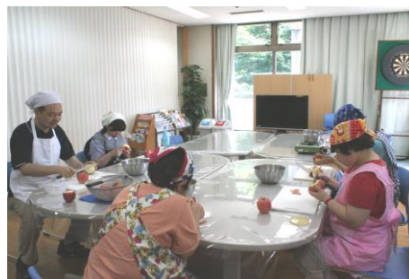
ハンドメイド教室