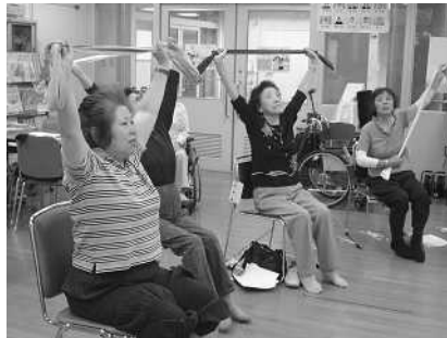
健康講座(ヨガ教室)